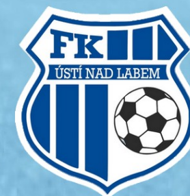
FK Ústí nad Labem